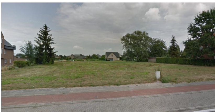
: percelen 356/E en 356/F

Het betreft de percelen gelegen Mechelsesteenweg ZN, 4de afdeling sectie B nrs. 356/F en 356/E met gezamenlijke oppervlakte van 1.880,39m 2 .